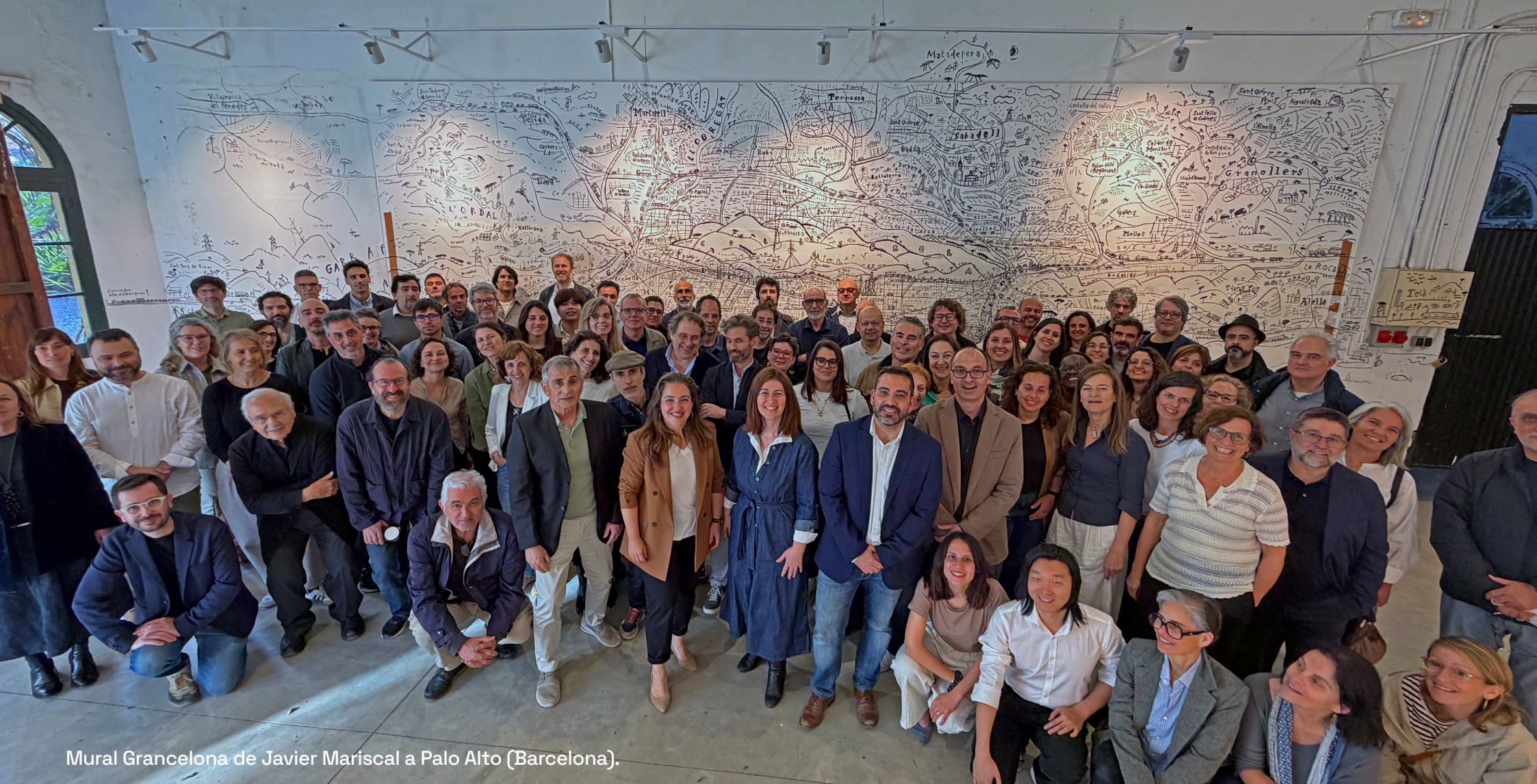
Mural Grancelona de Javier Mariscal a Palo Alto (Barcelona).